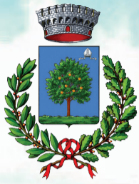
COMUNE DI POMARETTO