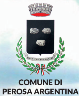
COMUNE DI PEROSA ARGENTINA