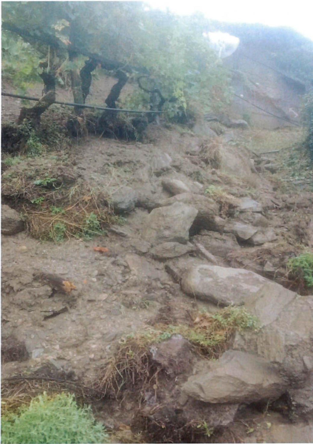
Foto 1 dissesto con crollo del muro