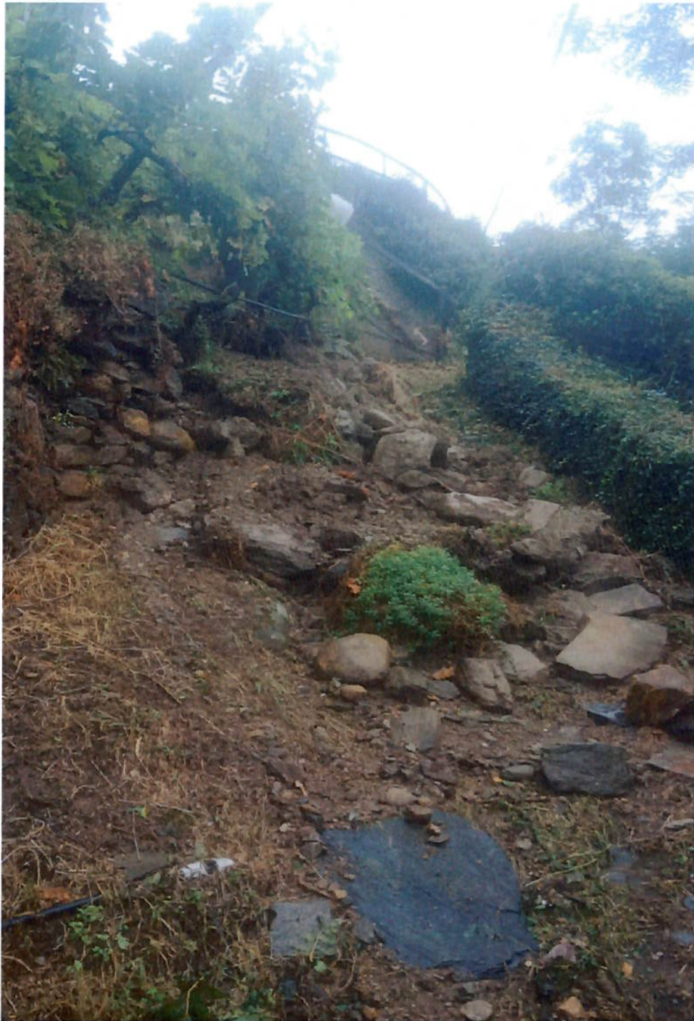
Foto 2 muro crollato