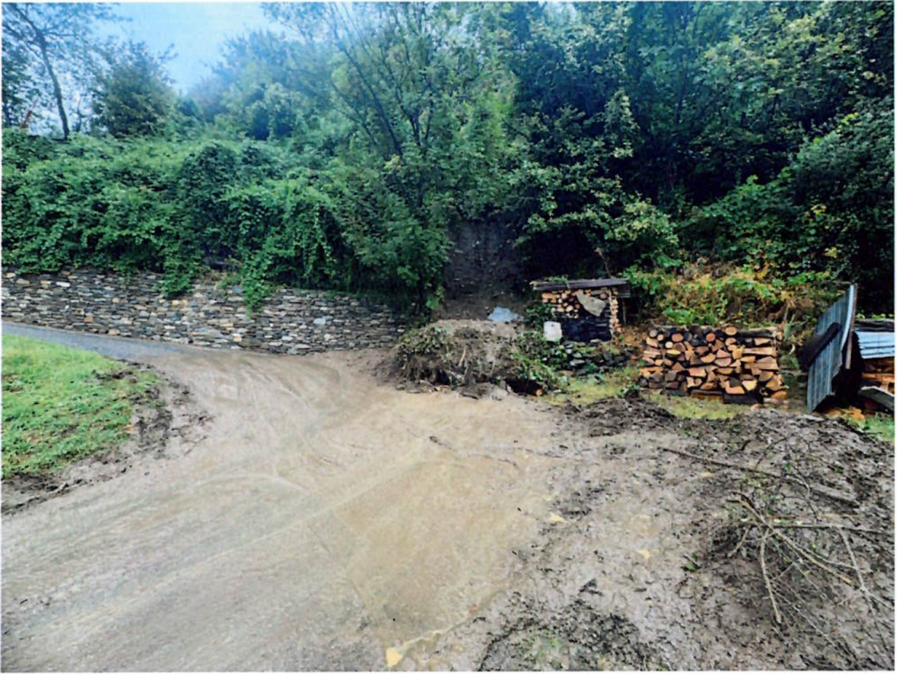
Foto 2 dissesto del versante