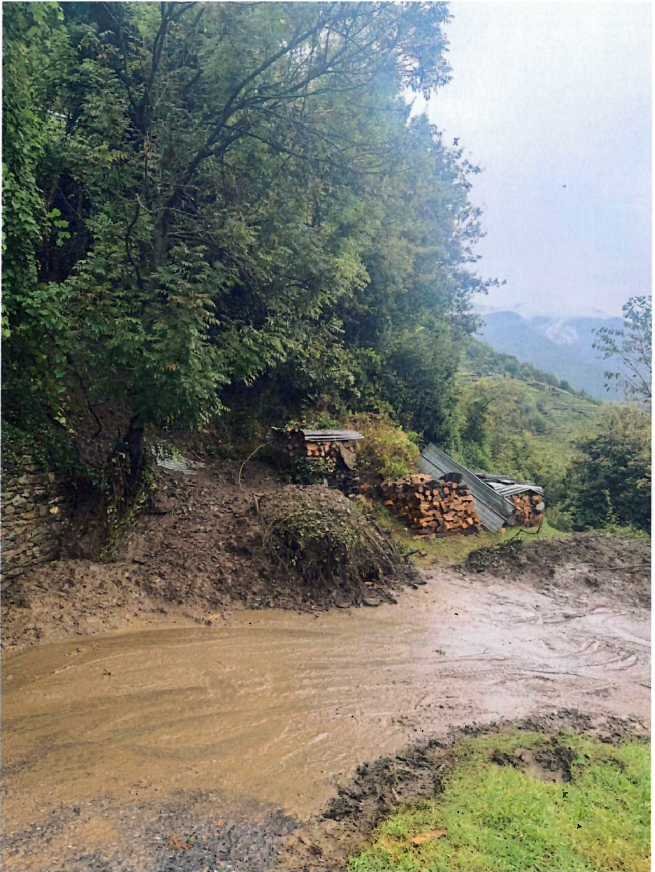
Foto 1 sedime stradale parzialmente invaso