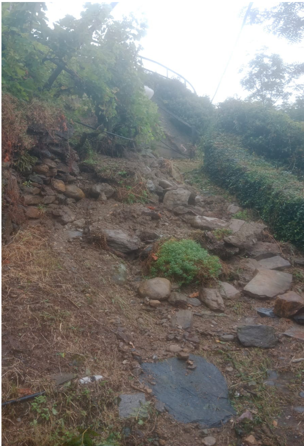
Foto 2 muro crollato