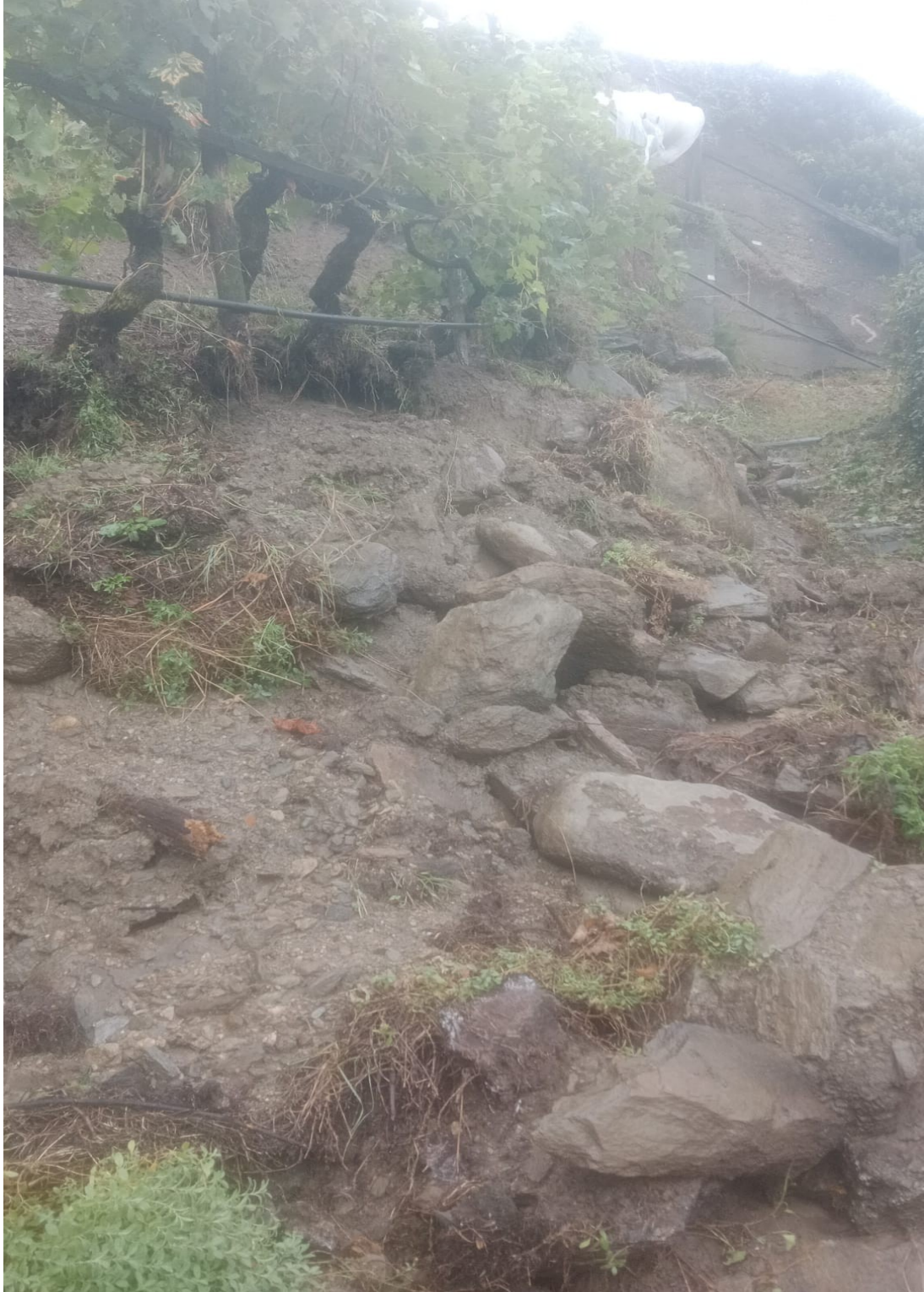
Foto 1 dissesto con crollo del muro